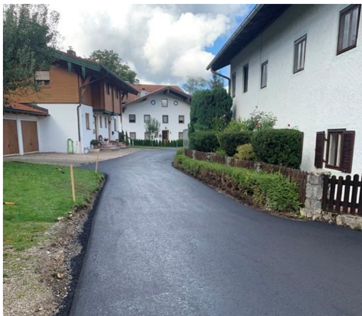
Foto: Instandsetzung Straße Egerndach 2022